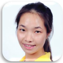
SBC 6-50 YANG MU (ตา) CHINA Faculty of Humanities Chiangrai Rajabhat University