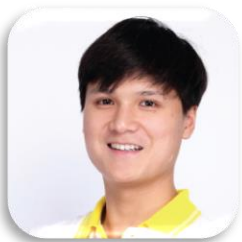
SBC 11-08 เขตฐานทัพบ ประสงค์สำเร็จ (แจ๊คพอท) คณะเศรษฐศาสตร์ มหาวิทยาลัยธรรมศาสตร์