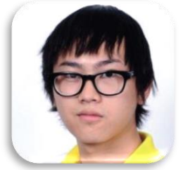
SBC 5-50 SAI SUAN CHAI (ซันไซน์) ประเทศเมียนมาร์ สำนักวิชาเทคโนโลยีสารสนเทศ มหาวิทยาลัยแม่ฟ้าหลวง