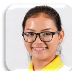
SBC 9-44 MUOYLEAPH KRY (ชมพู่) ประเทศกัมพูชา คณะเทคโนโลยีการเกษตร มหาวิทยาลัยราชภัฏสกลนคร