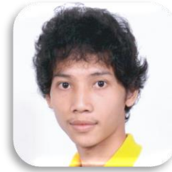
SBC 4-48 ENG PUTHYKAR (กาท้า) CAMBODIA Faculty of Informatics Burapha University