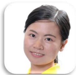
SBC 8-45 LI JU (ฟ้า) ประเทศจีน คณะมนุษยศาสตร์ มหาวิทยาลัยราชภัฏเชียงราย