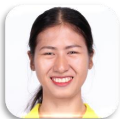
SBC 11-46 ILANG IM (เมย์) ประเทศกัมพูชา คณะศิลปศาสตร์และวิทยาการจัดการ มหาวิทยาลัยสงขลานครินทร์