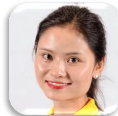
SBC 9-43 LI NI (ใบยอ) ประเทศจีน คณะมนุษยศาสตร์ มหาวิทยาลัยราชภัฏเชียงราย