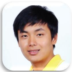
SBC 6-49 SEYHAK KHON (สิงโต) CAMBODIA Faculty of Accountancy and Management Mahasarakham University