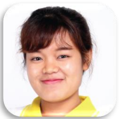
SBC 11-49 NANG KAINE NA YEE (ยู) ประเทศเมียนมาร์ สำนักวิชาเทคโนโลยีสารสนเทศ มหาวิทยาลัยแม่ฟ้าหลวง