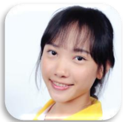
SBC 6-45 PHUONGTEPSONICH NGUON (ลาล่า) CAMBODIA Fac. of Accountancy And Management Mahasarakham University