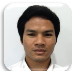
SBC 3-44 MAMPAN SANGSA (แบงค์) ประเทศกัมพูชา คณะวิศวกรรมศาสตร์ มหาวิทยาลัยบูรพา