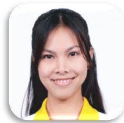
SBC 4-14 นิชิวา เหมินเส็บ (ซีเรีย) คณะสถาปัตยกรรมศาสตร์ ผังเมือง และนฤมิตศิลป์ มหาวิทยาลัยมหาสารคาม