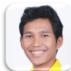
SBC 4-47 EK SAMOEURN (ยาว) CAMBODIA Faculty of Engineering Burapha University