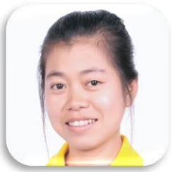
SBC 4-54 VIENG SYLONG (สาว) CAMBODIA Faculty of Tourism and Hotel Management Mahasarakham University