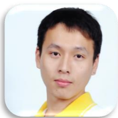
SBC 6-42 LUN HEI (หลุน) CHINA School of Liberal Arts Mae Fah Luang University