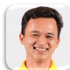
SBC 9-47 SARY YOU (นัฐ) ประเทศกัมพูชา คณะวิทยาศาสตร์ มหาวิทยาลัยราชภัฏบุรีรัมย์