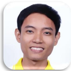
SBC 7-49 VICHHEKA TRY (กา) CAMBODIA Faculty of Education Khon Kaen University