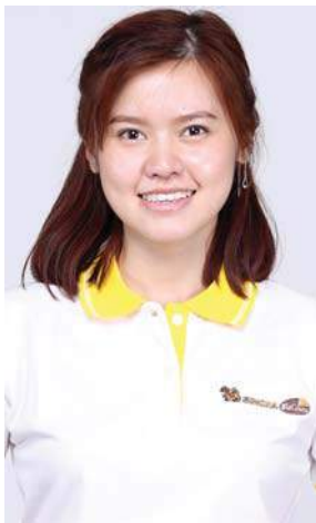
SBC X-06 จามจูรี พิสัยเลิศ (ไหมทอง) คณะบริหารธุรกิจ มหาวิทยาลัยเชียงใหม่