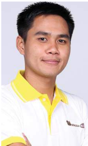
SBC X-44 Chreanvutha Im (วุฒิจิ) ประเทศกัมพูชา คณะวิทยาศาสตร์ มหาวิทยาลัยมหาสารคาม