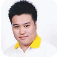
SBC 4-35 ศตวรรษ ณ บางช้าง (นอร์) คณะการสื่อสารมวลชน มหาวิทยาลัยเชียงใหม่