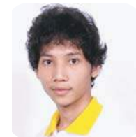
SBC 4-48 Eng Puthykar (ทาก้า) Faculty of Informatics Burapha University นักศึกษาจากประเทศกัมพูชา