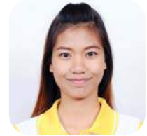
SBC 6-20 ปักสาส จุลสาลี (เทต) คณะสังคมศาสตร์ มหาวิทยาลัยศรีนครินทรวิโรฒ