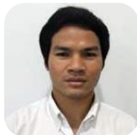
SBC 3-44 Mampan Sangsa (แมงค) คณะวิศวกรรมศาสตร์ มหาวิทยาลัยบูรพา นักศึกษาจากประเทศกัมพูชา