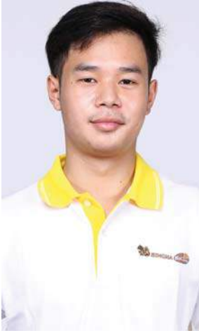
SBC X-19 ธีติวธรรม์ เศรษฐแสงศรี (โอ) วิทยาลัยนานาชาติ มหาวิทยาลัยขอนแก่น