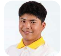
SBC 9-15 รชต มกรสุด (ตุ๋ตุ๋) คณะเทเลวิทัศน์ มหาวิทยาลัยบูรพา