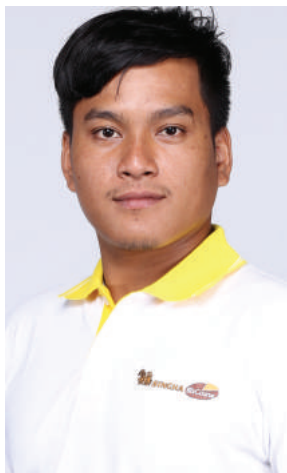
SBC X-42 Borey Leang (นาก) ประเทศกัมพูชา คณะวิทยาการจัดการ มหาวิทยาลัยราชภัฏบุรีรัมย์