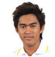
SBC 2-36 sunn สุขสง (ตีก) คณะบริหารธุรกิจ มหาวิทยาลัยมหาดไทย