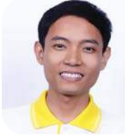
SBC 7-49 Vichheka Try (ท) (CAMBODIA) Faculty of Education Khon Kaen University