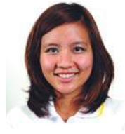
SBC 2-21 พิมพ์มล พันธุ์ท้าย (พิมพ์) คณะบริหารธุรกิจ มหาวิทยาลัยเกษตรศาสตร์