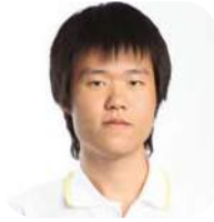
SBC 1-31 สภาพร ยินนัยธรรม (หนึ่ง) คณะพาณิชยศาสตร์และการบัญชี จุฬาลงกรณ์มหาวิทยาลัย